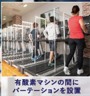
有酸素マシンの間にパーテーションを設置