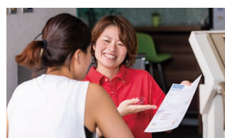
カウンセリング・ InBody測定

カウンセリングで会員様の話を伺った後、InBody測定を行い目標設定を行います。