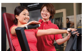
メニュー作成・ トレーニング・栄養指導など

カウンセリングで会員様の話を伺った後、InBody測定を行い目標設定を行います。